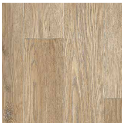
MADRID 2 ширина 2/2,5/3/3,5/4 м