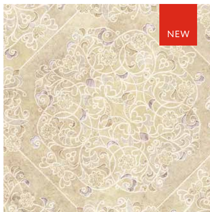
LACE 2 ширина 2,5/3/3,5/4 м