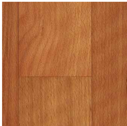
NEVA 1 ширина 1,5 / 2 / 2,5 / 2,9 / 3 / 3,1 / 3,5 / 4 м