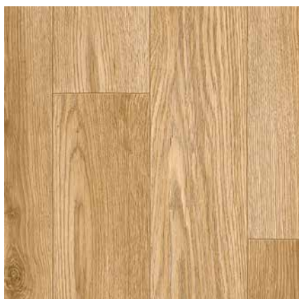
MADRID 1 ширина 2/2,5/3/3,5/4 м