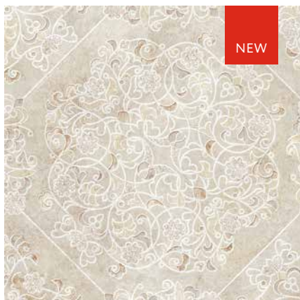
LACE 1 ширина 2,5/3/3,5/4 м