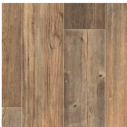
TORONTO 1 ширина 1,5/2/2,5/3/3,1/3,5/4 м