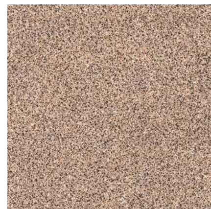
SAHARA 3 ширина 1,5/2/2,5/3/3,5/4 м