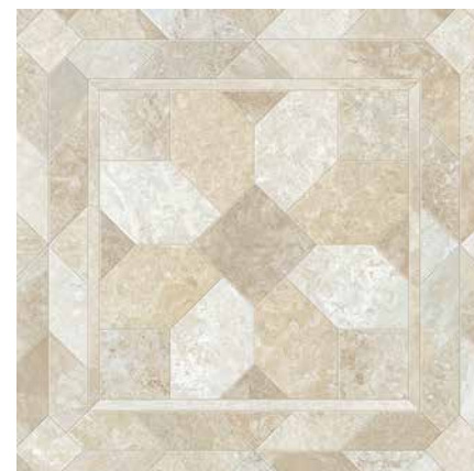
MARCO 1 ширина 2,5/3/3,5/4 м