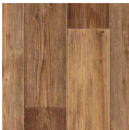
TORONTO 2 ширина 1,5/2/2,5/3/3,5/4 м